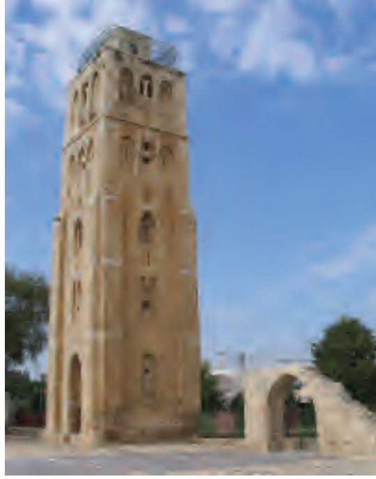
مِئْدَنَةُ الْجَامِعِ الْأَبْيَضِ فِي الرَّمْلَةِ